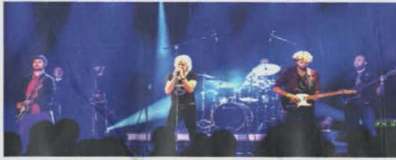
Les Rolling The Stones jouent les tubes de la bande à Mick Jagger le samedi 3 août.

Samedi 3 août Fête musicale 3 concerts 100% live Vers 21h, 30 et 45 MANUCHEEN assurera la première partie du concert de Rolling The Stones, formation tribune des Rolling Stones. Le public pourra entendre de nombreux titres du groupe de rock légendaire dirigé par Mick Jagger. Chanteur, guitariste, compositeur et multi-instrumentiste, Mick Jagger est un véritable roi de la scène. Depuis 1962, il a écrit plus de 100 chansons et a participé à plus de 100 concerts. Il est considéré comme l'un des plus grands chanteurs de rock de tous les temps. THE BIDDY'S , groupe pop rock de la région, proposera un répertoire de