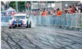
Le kart proto a fait sensation.