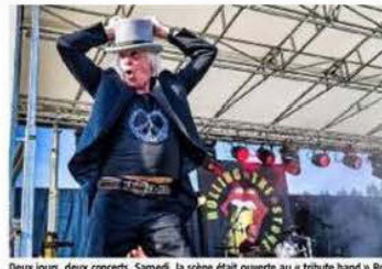
Deux jours, deux concerts. Samedi, la scène était ouverte au « tribute band » Rolling The Stones.