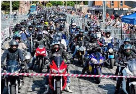
Cette année encore, la balade à moto a attiré de nombreux engins.

Organisateurs et bénévoles peuvent se féliciter, cette 16 e édition fut une réussite. Des stunts plus impressionnants les uns que les autres, un maximum de motos pour la balade et pas loin de 17 000 festivaliers à Bouchain durant le week-end.