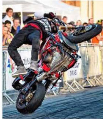
Les stunts étaient plus impressionnants les uns que les autres