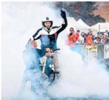
Un show final tout en fumée !